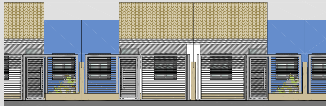
Alzado Vallado Exterior _ 1/100