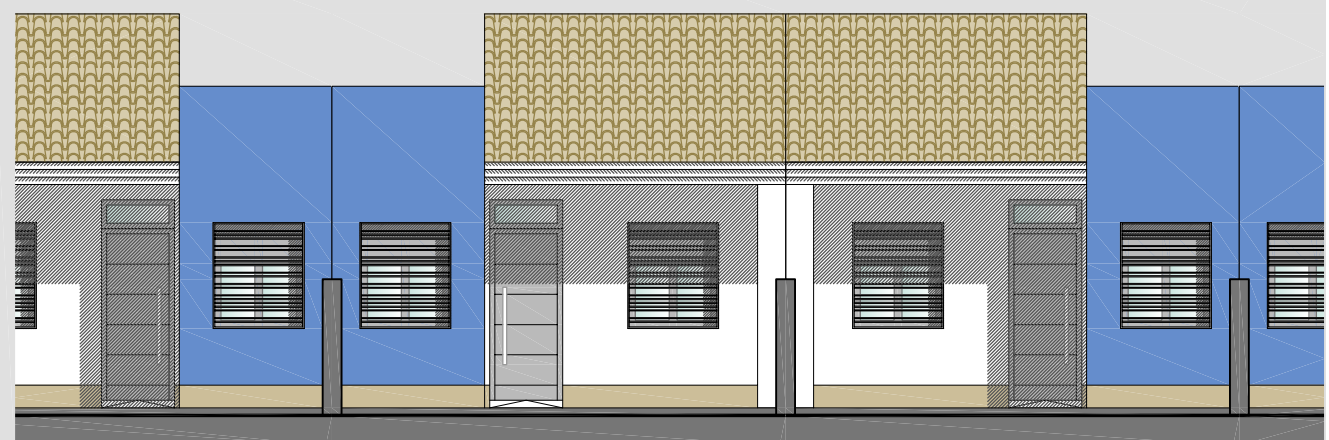
Alzado de Viviendas _ 1/100